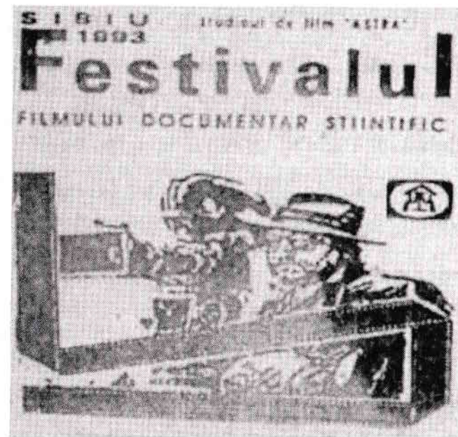
Un afiș al festivalului, publicat în ziarul „Tribuna” din data de 29 octombrie 1993

„Nu erau mecanisme pentru sprijin financiar sau de altă natură din partea instituțiilor care administrau